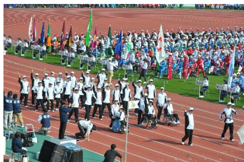
2015 年 紀の国わかやま大会

史上初の全大会中止を機会に、過去の大会を写真で振り返ります。懐かしく回想される方もおられるのではないのでしょうか。