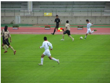
2010 年 ゆめ半島千葉大会