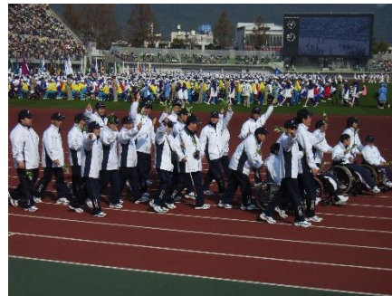
2005 年 輝いて！おかやま大会