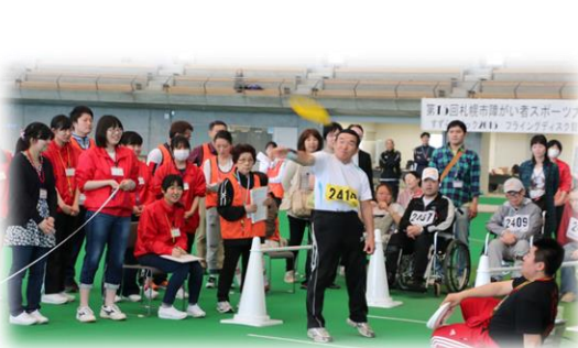
フライングディスク競技