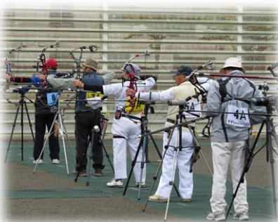
アーチェリー競技