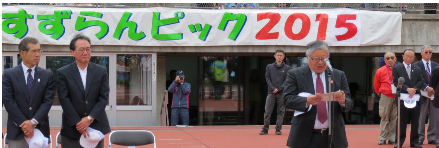
開会の挨拶をする板垣副市長