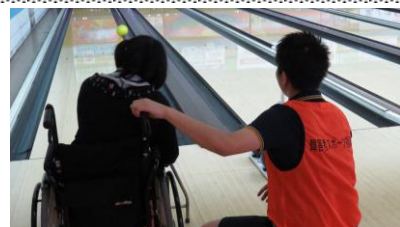
ボウリング大会投球助

講習会の詳細は当協会のホームページの「平成27年度初級障がい者スポーツ指導員養成講習会開催要綱」をご覧ください。