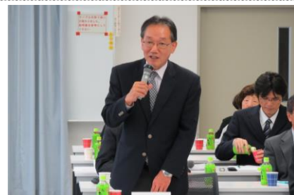
挨拶をする浅香会長