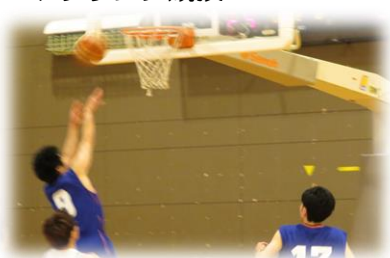
バスケットボール競技