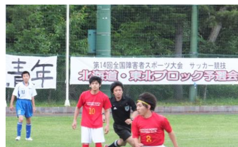
白旗山競技場 サッカー競技