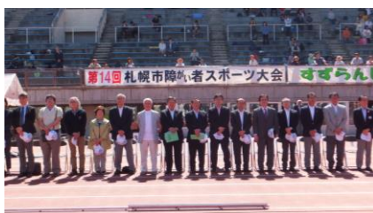
競技役員の皆さん