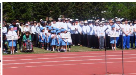
ボランティアの皆さん